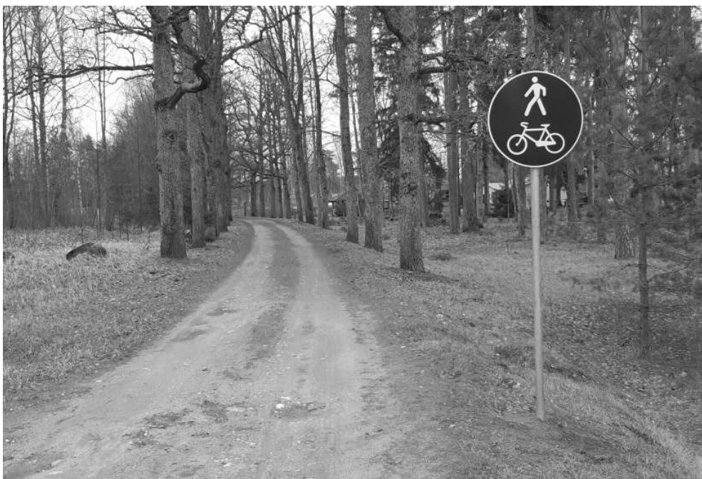
Turpmāk Ozolu gatve Naukšēnos būs gājēju un velosipēdistu ceļš

Aicinām iedzīvotājus būt vērīgiem un ziņot par pārkāpumiem, zvanot: 27887736 (Pašvaldības policija).