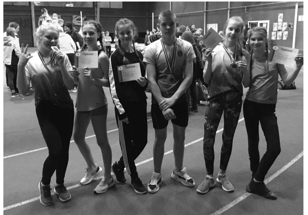
U—14 vecuma grupas vieglatlēti

Teksts un foto Inese Grava Sporta trenere