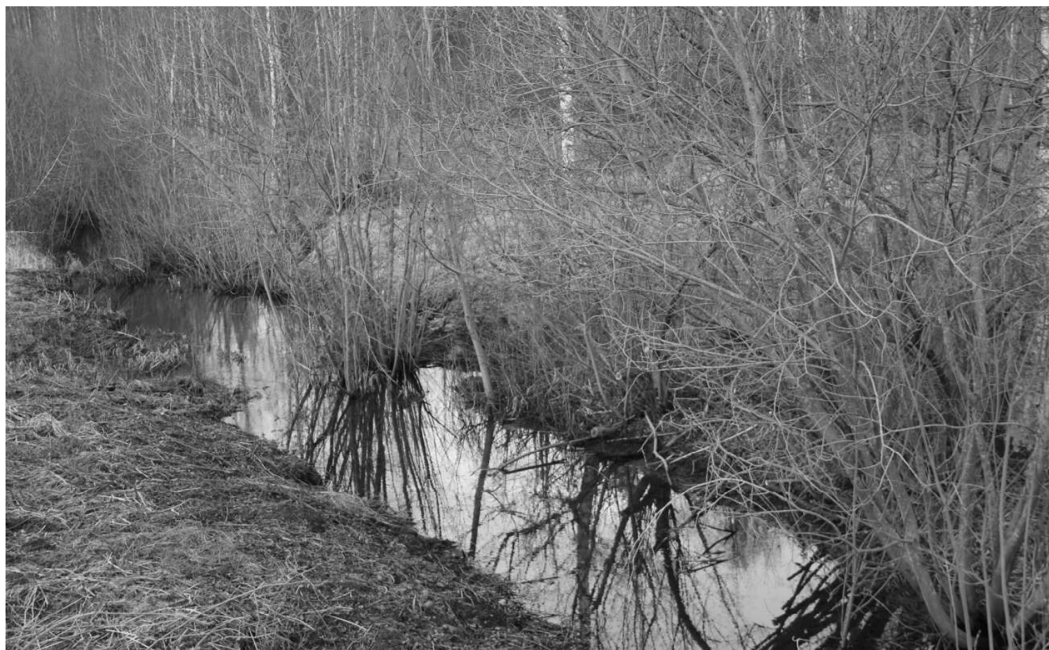
Meliorācijas sistēma “Rausele” Naukšēnu pagastā

Ilgstoši novērojot, ka lielākā daļa meliorēto zemes platību īpašnieki (meliorācijas sistēmas daļu īpašnieki/tiesiskie valdītāji) nerūpējas par meliorācijas koplietošanas grāvju kopšanu, pašvaldība izlēma noteikt pašvaldības nozīmes koplietošanas meliorācijas sistēmas statusu vairākām meliorācijas sistēmām Naukšēnu novada teritorijā. Ar Naukšēnu novada pašvaldības domes 2015.gada 19.augusta lēmumu “Par ieceri piešķirt pašvaldības nozīmes koplietošanas meliorācijas sistēmas statusu”, /protokols Nr. 8, 6.§/, tika noteiktas koplietošanas meliorācijas sistēmas, kurām