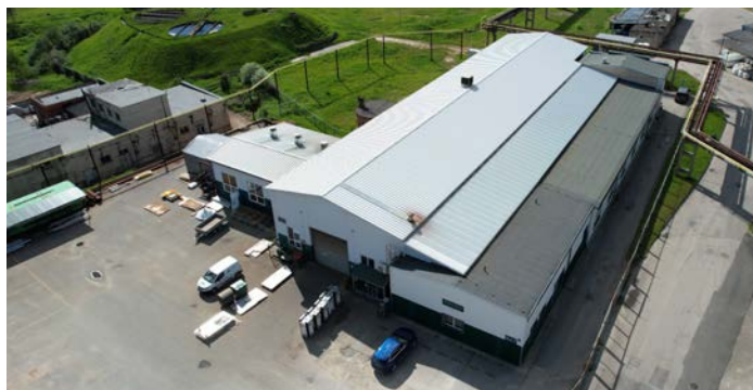
SIA "Metāro"

Uzņēmuma piedāvāto pakalpojumu klāstā ietilpst daudzveidīgi metālapstrādes pakalpojumi, rezerves daļu, kā arī nestandarta iekārtu un aprīkojuma projektēšana, izgatavošana un uzstādīšana traktoriem, kravas automašīnām un citai industriālai tehnikai. Uzņēmums izgatavo un ražo universālu kūdras izstrādes tehniku, kā arī īpašs produkts ir traktors jeb forvarders "Deep Forest 612D", kas radīts darbam nelabvēlīgos grunts apstākļos. Izstrādātās tehnikas piedāvājumā ir universāla stādu stādāmā mašīna, dēļu transportieris, meža degvielas tvertnes un citas lauksaimniecībā, mežizstrādē, būvniecībā, ceļu būvē un pat militārajā jomā pielietojamas iekārtas. Uzņēmums īpašu vērību pievērš attīstībai un energoefektivitātes paaugstināšanai.