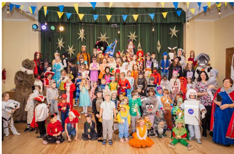
Kuplais un krāšņais karnevāla dalībnieku pulks

Velga Graumane, Biedrības "Glābiet bērnus" Strenču nodaļas vadītāja