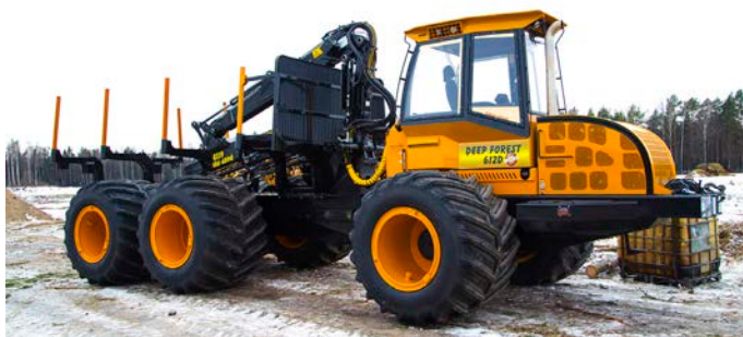
SIA "Ciedra Pro" forvarders "Deep Forest 612D"