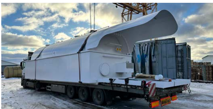
SIA "Valtanks" degvielas uzglabāšanas rezervuārs

SIA "Metāro" piedāvā metālapstrādes pakalpojumus, kā arī nestandarta ražošanas iekārtu projektēšanu un izgatavošanu un industriālās tehnikas remontu. Uzņēmums fokusējas uz ilgtspējīgu darbību - investē jaunās paaudzes iekārtās, IT, piesaista un apmāca jaunus speciālistus, paaugstina esošo darbinieku profesionalitāti. Esošās vecās tehnoloģijas tiek aizvietotas un papildinātas ar jaunām ciparvadības tehnoloģijām, lai uzņēmumam ir iespējas sniegt pilnvērtīgu pakalpojumu klientiem. Arturs Ščukins , SIA "Metāro" vadītājs: "Mūsu uzņēmums sniedz pakalpojumus daudzām nozarēm, tādēļ esam atkarīgi no pasūtītāja nozari ietekmējošiem faktoriem. Šajā gadā plānots turpināt uzņēmuma digitalizācijas procesu, kas veiksmīgi uzsāks jau pērn."