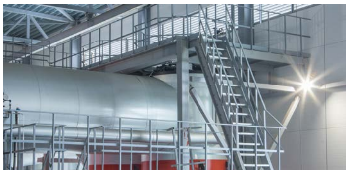
SIA "Daupro" produkcija