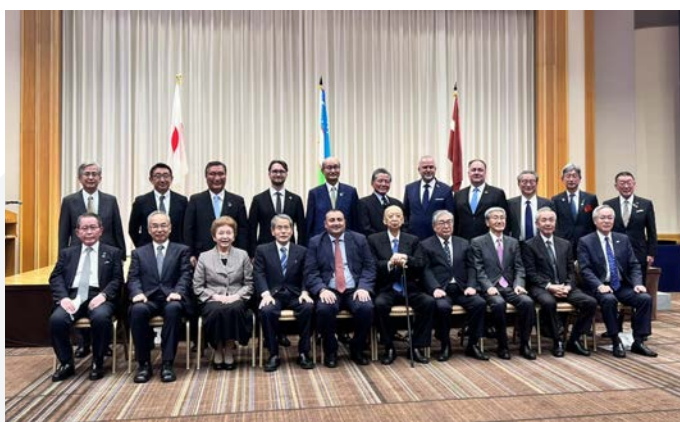
Konferencē "Zīda ceļa globālais dizains" pēc Saprāšanās memoranda parakstīšanas