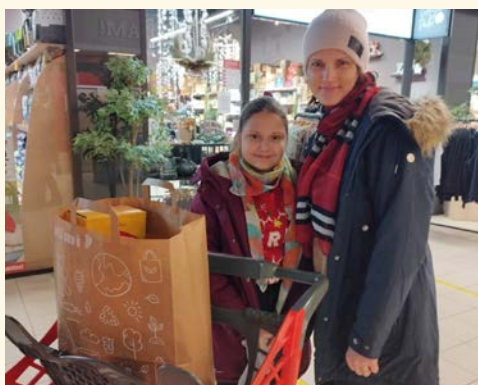
Prieks, ka akcijā iesaistījās ģimenes ar bērniem

Biedrības "Glābiet bērnus" Strenču nodaļa