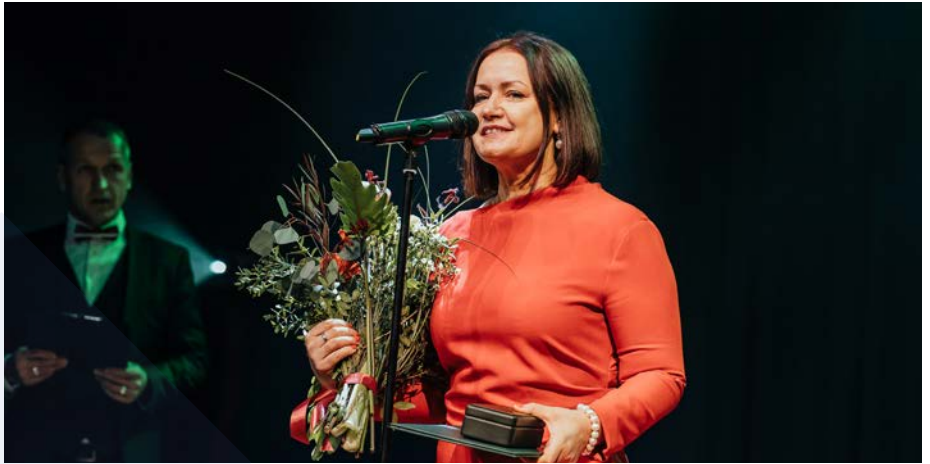
"Paldies Valmierai, kas ļāva man strādāt radoši!"

Grāmatas tapšanas laikā gandrīz divu gadu garumā mēroti tuvi un tāli ceļi, lai intervētu vairāk nekā 80 cilvēku. Turklāt sarunas ar grāmatas varoņiem noritēja vairākās kārtās. "Skolotājus intervēju pirms un pēc mācību stundām, brīvdzīvē, rītos un vakaros, mājās, dārzos, pie radiem, pat kapos, kultūras namos un citās vietās. Skaistas takas mēs izstaigājām kopā ar grāmatas redaktori Dainu Sirmo. Kopā aptuveni 270 sarunas izgāja cauri maniem pirkstiem. Turklāt sarunājos gan ar radi-