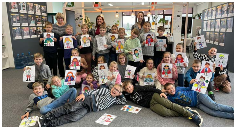
Valmieras Viestura vidusskolas 3.b klases skolēni LIAA Valmieras biznesa inkubatorā