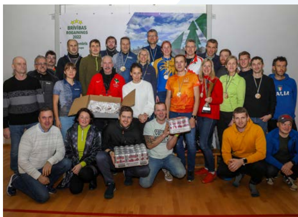
Valmieras novada komanda

Šis bija jau sestais Brīvības rogaininga, un vienlaikus ar Brīvības rogaininga Pašvaldību kausu notika sacensības arī Brīvības rogaininga 6 stundu un 3 stundu distancē ģimeņu komandām, kas bija pēdējās Latvijas reitinga rogaininga sacensības 2022. gadā.