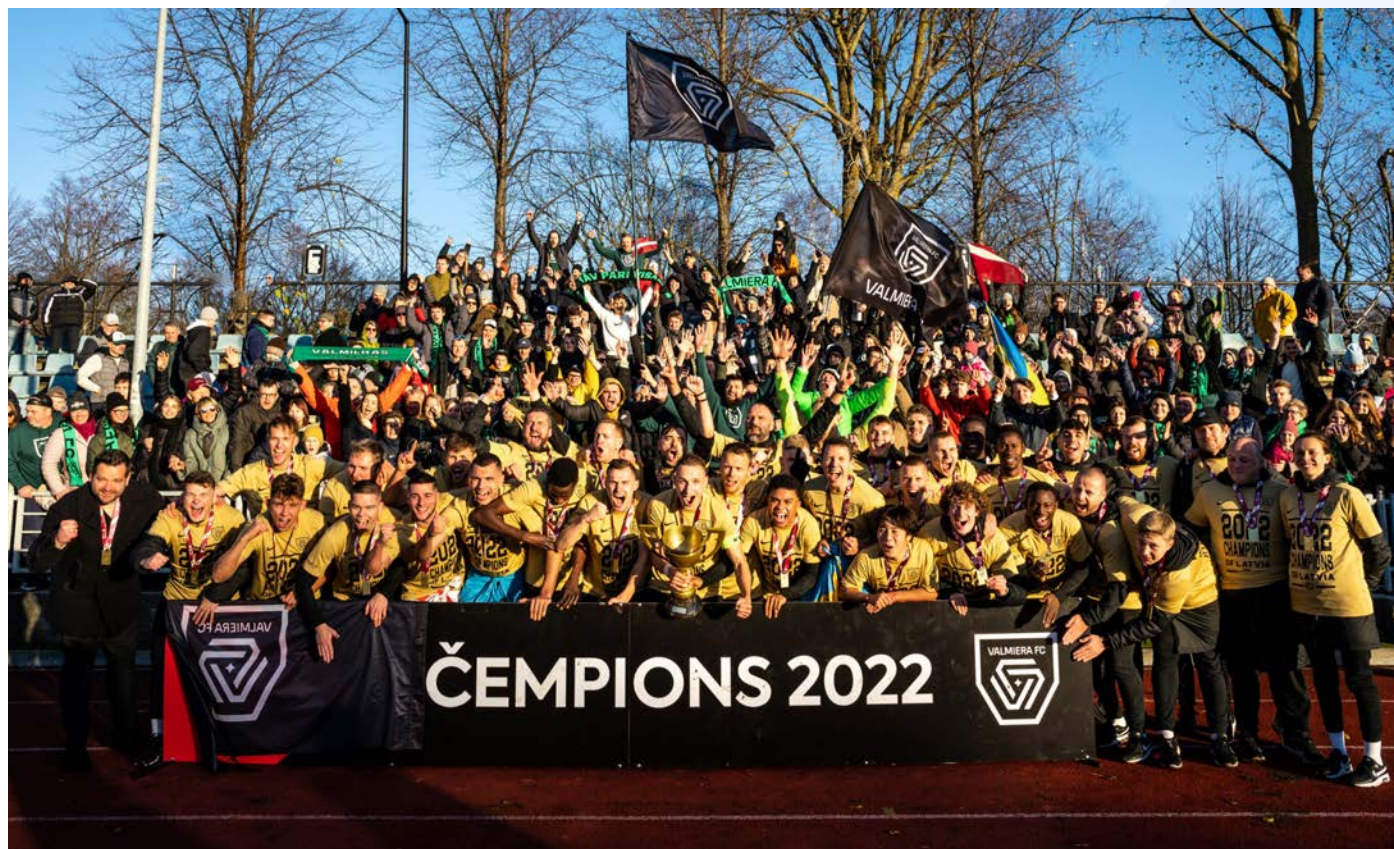
Turpmāko gadu Latvijas futbola Virslīgas čempionu kausa mājvieta būs Valmiera