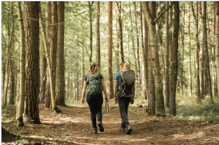
"konTŪRE" - ideja aktīvai atpūtai kopā ar ģimeni