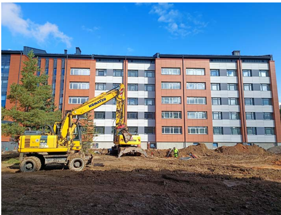
Līdz ar dienesta viesnīcas pārbūvi labiekārto ēkas apkārtni