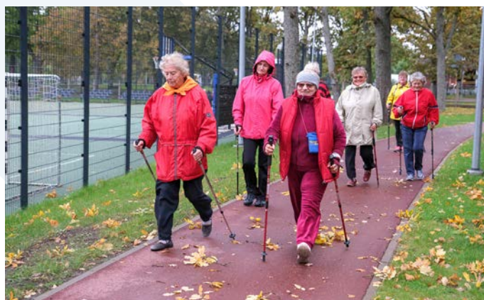
Senioru sportiskās aktivitātes Jāņa Daliņa stadionā

sportiskajās aktivitātēs – šautriņu mešanā, basketbola bumbas metienos, kornholā, nūjošanā un Valmieras novada fonda rīkotajā stafetē.