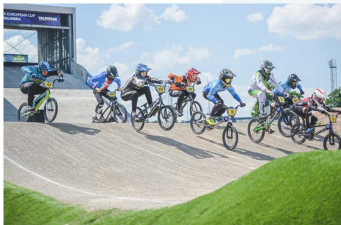
Eiropas BMX kausa posma sacensības Valmierā

Savukārt nākamgad Valmierā notiks UEC Eiropas kausa BMX 5. un 6. posma sacensības. Šāds gods mūsu valstij jau otro gadu pēc kārtas. Bez Valmieras posmiem Eiropas kausa posmi notiks arī Veronā (Itālijā), Zolderā (Beļģijā), Benaktijā (Čehijā),