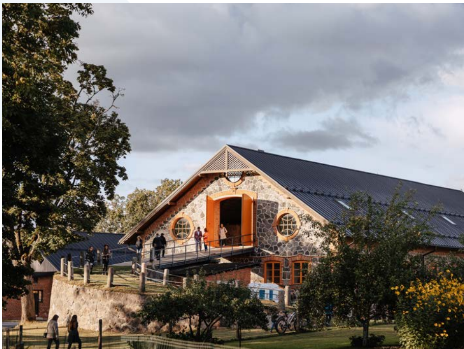
Atjaunotā ēka durvis vēra Kokmuižas svētku apmeklētājiem