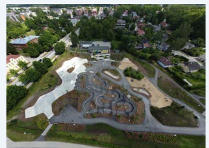
Sporta un aktīvās atpūtas parks “Mežs”