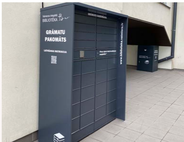
Grāmatu pakomāts pieejams visu diennakti

Turpinot attīstīt klientiem nepieciešamos pakalpojumus arī ārpus bibliotēkas darba laika, ikvienam ērtā diennakts stundā pie Valmieras integrētās bibliotēkas ieejas ir pieejams grāmatu pakomāts bibliotēkas grāmatu un citu iespieddarbu saņemšanai.