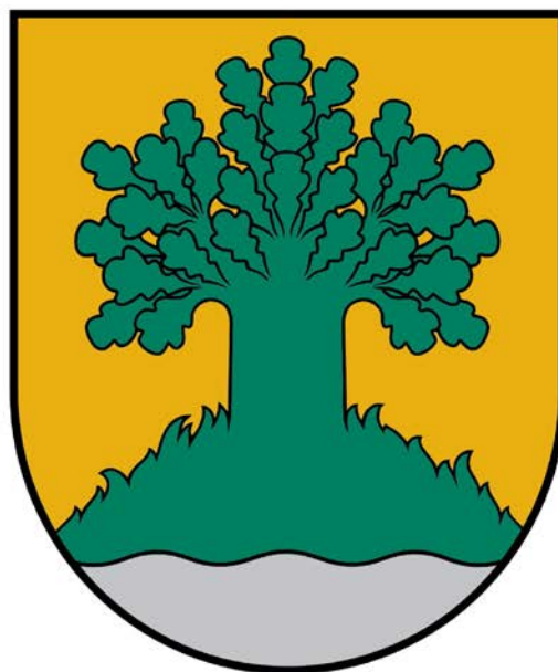
Valmieras novada ģerbonī redzams zelta laukā zaļš ozols uz pakalna un simbolisks ūdens motīvs

Ar sudraba krāsu heraldikā apzīmē ūdeni, tas simbolizē dzīvību un dinamiku.