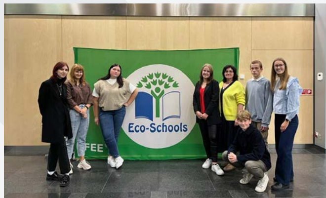
Valmieras Viestura vidusskolas pārstāvji Ekoskolu apbalvošanas ceremonijā