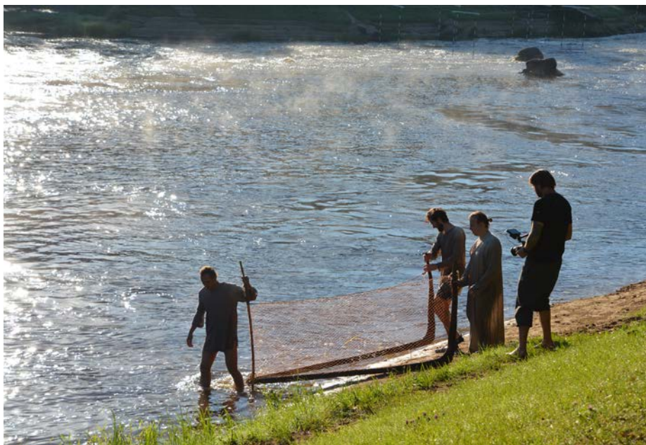
Valmieras muzejs video stāstos iemūžina seno amatu prasmes

Ši gada izskaņā Valmieras vēsturiskajā centrā atklās Valmieras pils kultūrvides centru un ekspozīciju "de Wolde-mer". Tajā būs skatāmi, lasāmi, klausāmi un pat taustāmi stāsti par Valmieras vēsturi. Daži video stāsti, kas tika filmēti vasarā, aicina iepazīt amatu prasmes un senos darbarīkus.