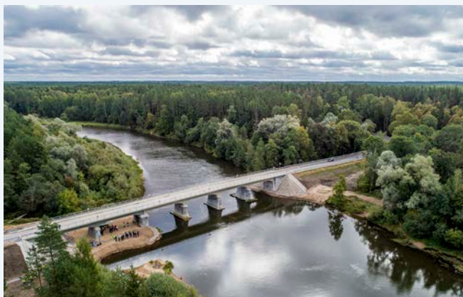
Visā brauktuves platumā ieklāts vēsturiskais bruģakmens