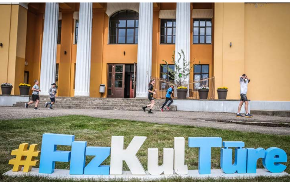
7. posms 1. jūnijā Sedā

Valmieras novada skriešanas, nūjošanas un velobraukšanas seriāls “Fiz-Kul-Tūre” ir noslēdzies! Aizvadīti astoņi aizraujoši vakari, kad devāmies fiziski aktīvā un kulturāli bagātā tūrē, iepazīstot Valmieras novadu.