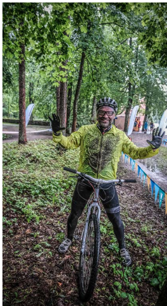
Sportotprieks, neskatoties uz laikapstākļiem!