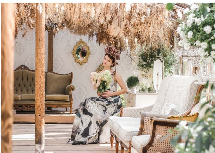
Sudrabkalnu Viesistaba.

Valmieras novads ir apņēmis turpināt izaugsmi, veicinot uzņēmējdarbības attīstību un veidojot dinamisku