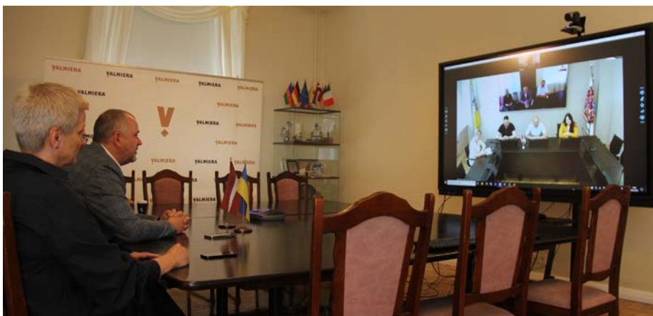
Valmieras novada pašvaldības un Čerkasi pašvaldības vadības tikšanās tiešsaistē