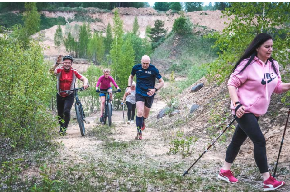
6. posms 25. maijā Ķoņu kalnā