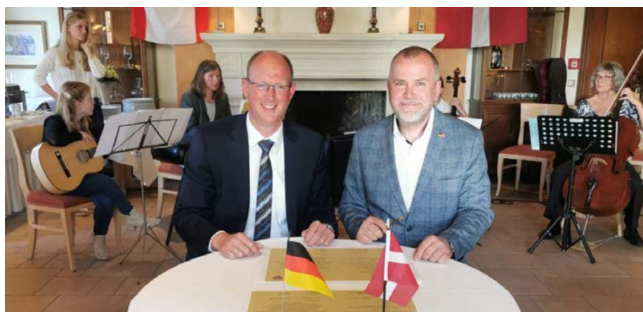
Parakstot vienošanos par Valmieras novada un Halles pilsētas sadarbības paplašināšanu