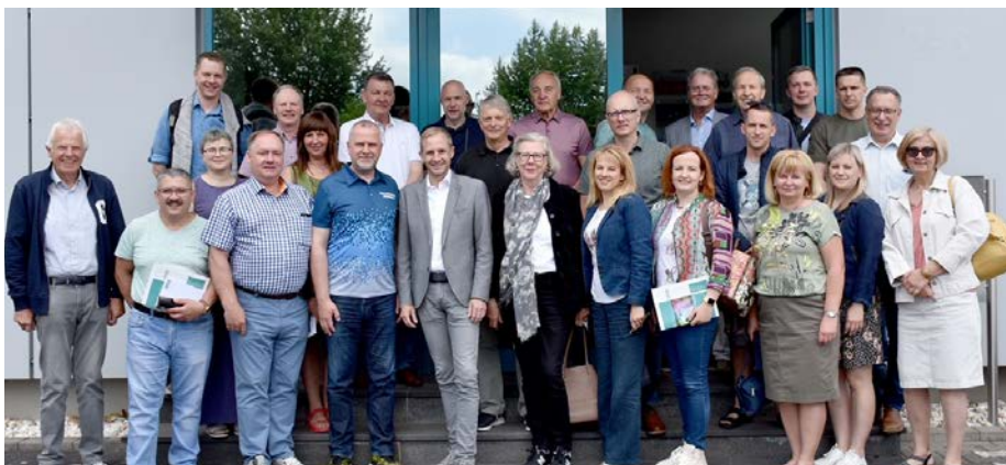
Venjakob lakošanas un krāsošanas iekārtu ražošanas uzņēmuma apmeklējums