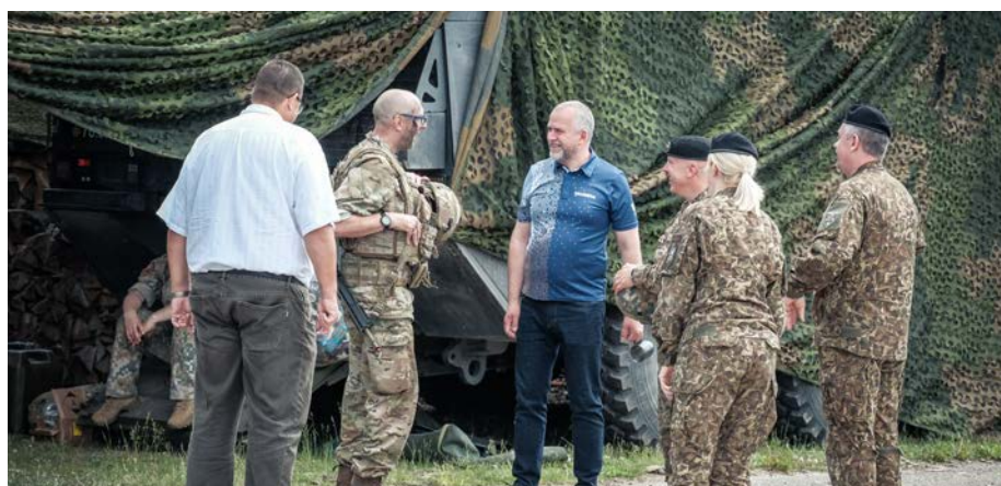
Veiksmīgi aizvadītas starptautiskās militārās mācības "Knight Swift 22"