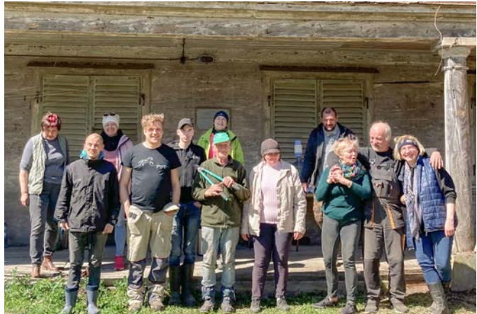
Talkotāji pie Vaidavas muižas kungu mājas