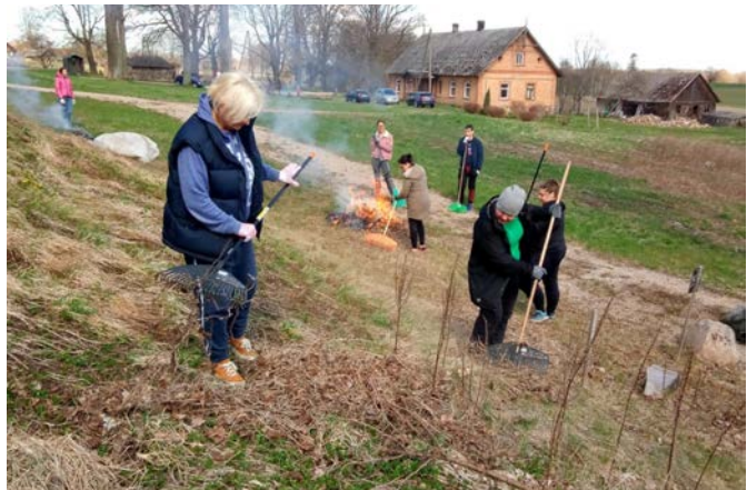
Trikātas baznīcas apkārtnes sakopšana