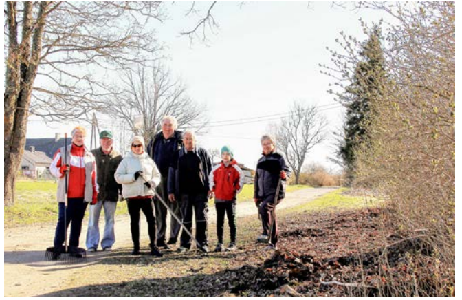
Lielā Talka Bērzaines ciemā