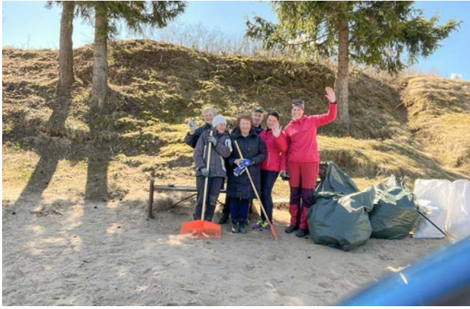
Lielajā Talkā sakopta Zilākalna karjera teritorija