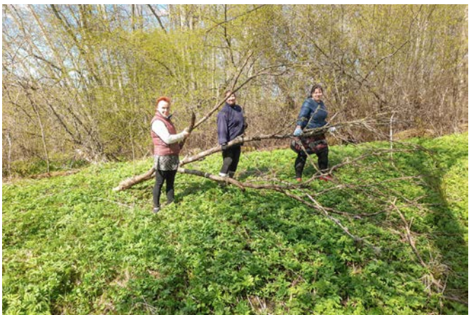
Talkotāji pie Šķiliņu avota Ēvelē

Paldies ikvienam, kurš piedalījās Lielajā Talkā un palīdzēja Valmieras novadam un Latvijai tapt tīrākam un skaistākam! Lai stiprina apziņu, ka arī paveicot nelielus darbus, kopā mēs varam paveikt daudz!