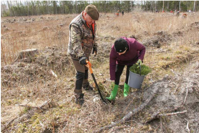
Meža stādīšana Mūrmuižā