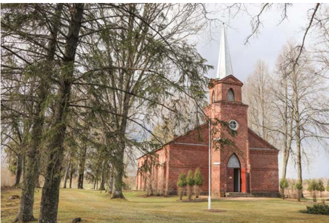
Talkotāju sakoptā Pīksāru baznīcas apkārtnē