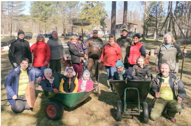
Talkotāji Strenčos, aktīvās atpūtas vietā "Birzīte"