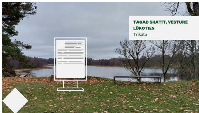
TAGAD SKATĪT, VĒSTURĒ LŪKOTIES Trikāta

bedriski nozīmīgs resurss, lai mazinātu atkritumu veidošanos (vides piesārņojuma mazināšana) no dzērienu pudelēm. Tas ļauj piekļūt ūdenim brīdī, ja klimata pārmaiņu rezultātā dzēriens nav pieejams.