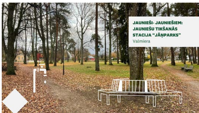
JAUNIEŠI- JAUNIEŠIEM: JAUNIEŠU TIKŠANĀS STACIJA "JĀNPARKS" Valmiera

Iesniedzējs: biedrība "Cerības pakāpiens", projekta izmaksas: ~ 30 000 EUR. Projekta ietvaros paredzēts uzstādīt trīs multifunkcionālos āra trenāžierus. Šie trenāžieri ir īpaši ar to, ka tiem iespējams regulēt ceļamo svaru plašā amplitūdā. Tādējādi tie būs piemēroti plašai auditorijai gan jauniešiem, gan pieaugušajiem, gan arī senioriem, jo katrs lietotājs spēs pielāgot slodzi, atbilstoši savam vecumam un fiziskajai sagatavotībai. Trenāžieri ir projektēti un ražoti Somijā. Tie izgatavoti no kvalitatīviem materiāliem un ir paredzēti lietošanai visu gadu neatkarīgi no laikapstākļiem. Trenāžieri ir biomehāniski pareizi izstrādāti, nodrošinot pareizas ceļšanas trajektorijas un lenķus, kas ļauj nodrošināt efektīvu treniņu un samazināt traumu risku.