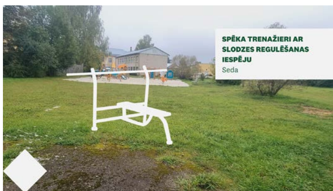
SPĒKA TRENAŽIERI AR SLODŽES REGULĒŠANAS IESPĒJU Seda

Iesniedzējs: biedrība "Valmiermuižas jātnieku skola", projekta izmaksas: ~ 12 000 EUR. Valmiermuižas Jātnieku skola (VJS) darbojas vēsturiskajās Valmiermuižas govju laidara ēkās, kas Valmiermuižā atradušās jau 19. gadsimta pirmajā pusē. Varena izmēra trīs ēku komplekss no laukakmeņiem veido pagalmu, ko noslēdz akmens mūra žogs ar vārtiem. Šobrīd žogu nepieciešams saglabāt un atjaunot. VJS uztur šīs ēkas labā kārtībā, veic nepieciešamos uzlabojumus, kā arī nodrošina nepieciešamo dzīvnieku turēšanai.