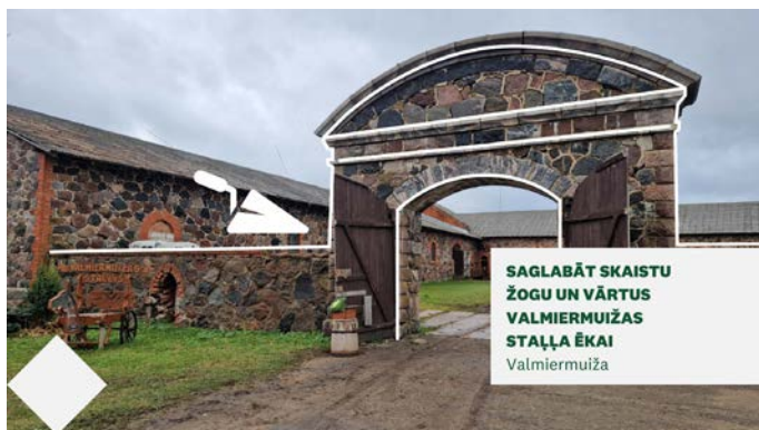
SAGLABĀT SKAISTU ŽOGU UN VĀRTUS VALMIERMUIŽAS STAĻĻA ĒKAI Valmiermuiža

Iesniedzējs: biedrība "Valmiermuižas jātnieku skola", projekta izmaksas: ~ 12 000 EUR. Valmiermuižas Jātnieku skola (VJS) darbojas vēsturiskajās Valmiermuižas govju laidara ēkās, kas Valmiermuižā atradušās jau 19. gadsimta pirmajā pusē. Varena izmēra trīs ēku komplekss no laukakmeņiem veido pagalmu, ko noslēdz akmens mūra žogs ar vārtiem. Šobrīd žogu nepieciešams saglabāt un atjaunot. VJS uztur šīs ēkas labā kārtībā, veic nepieciešamos uzlabojumus, kā arī nodrošina nepieciešamo dzīvnieku turēšanai.