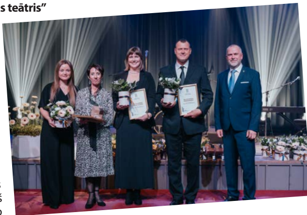
"Valmieras novada gada balva uzņēmējdarbībā 2023" nominācijas "Gada pakalpojuma sniedzējs" apbalvojumu saņēmēji.