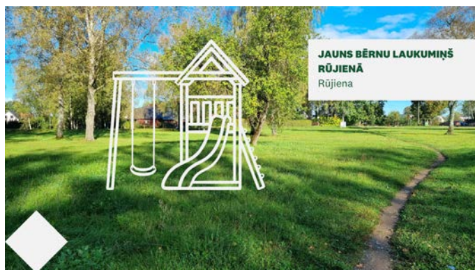
JAUNS BĒRNU LAUKUMIŅŠ RŪJENĀ Rūjiena