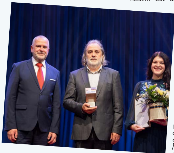
Uzvarētājs nominācijā Gada uzņēmums: SIA "VALPRO".

Justīne Skraščiņa, Valmieras Attīstības aģentūra