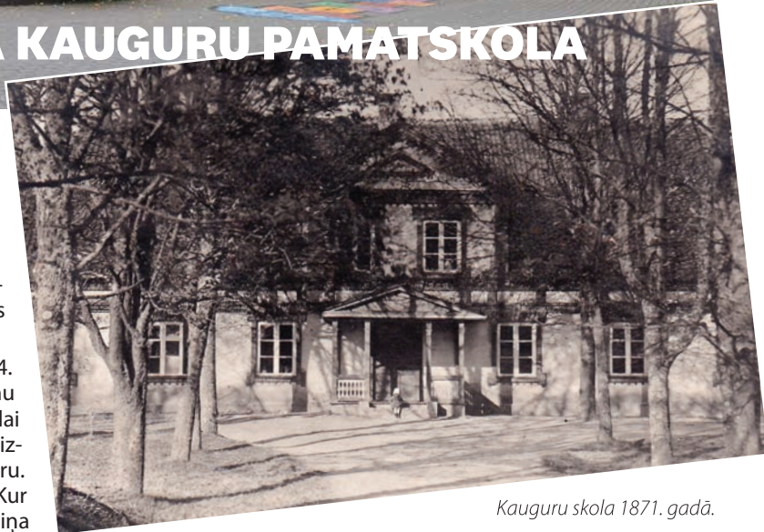
Kauguru skola 1871. gadā.