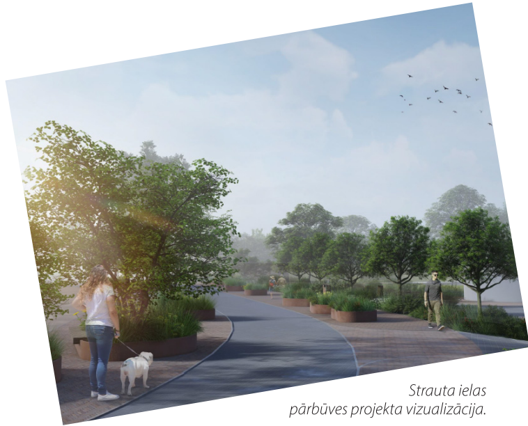
Strauta ielas pārbūves projekta vizualizācija.

Būvprojekts paredz esošās brauktuves un ietvju segumu pārbūvi. Savukārt jaunajām labiekārtojuma iecerēm izmantos ielai piegulošo teritoriju virzienā uz Rātsupīti. Ikdienā šeit ir intensīva gājēju un autotransporta kustība – šajā teritorijā nepieciešams paplašināt arī pieejamās autotransporta stāvvietas. Kopumā būs papildu 43 autostāvvietas, tai skaitā divas elektroautomobiļu uzlādei. Ielas labajā pusē, pret Rātsupītes gājēju tiltu, paredzēta apstāšanās vieta, lai droši izkāptu un iekāptu pasažieri, kuri dosies uz vecpilsētu.