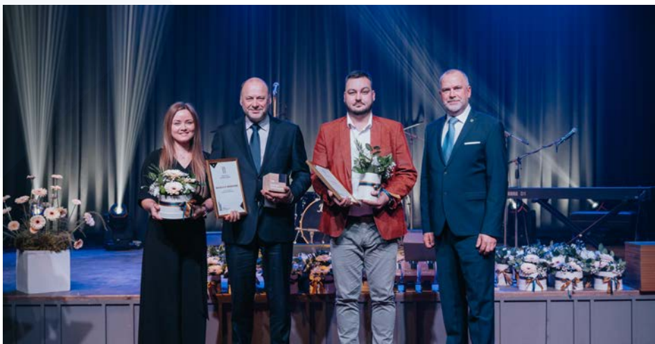
“Valmieras novada gada balva uzņēmējdarbībā 2023” nominācijas “Gada būvuzņēmums” apbalvojumu saņēmēji.